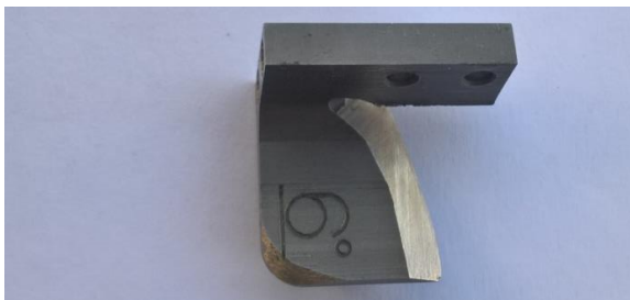
Radialmesser 6° Art. 880 178-451