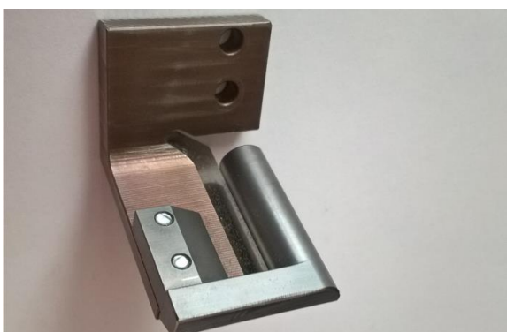
Konusmesser Art. 880 280-777