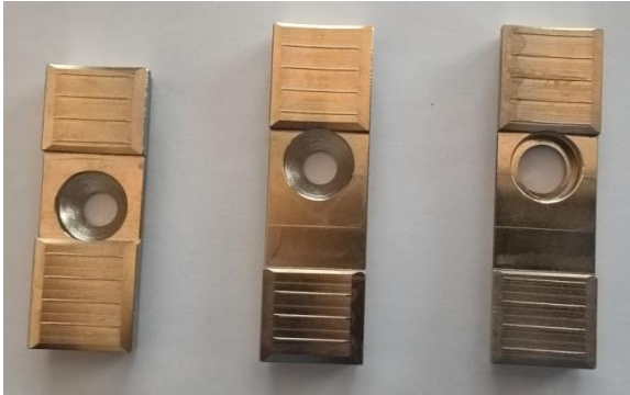
Vorschubbackenset für Feedjaw (neu)