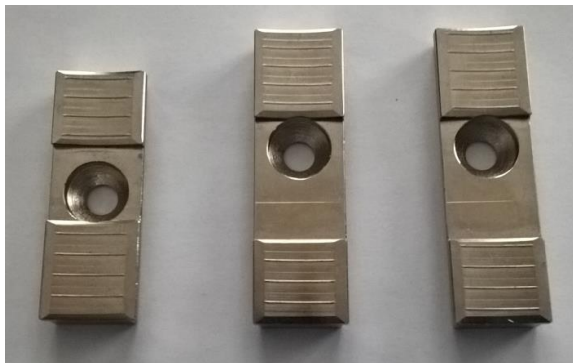
Vorschubbackenset für Solidjaw (alt)